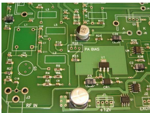
Printplaten met condensatoren (niet openmaken!)