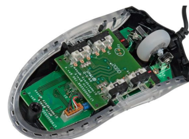
Printplaatjes in een muis